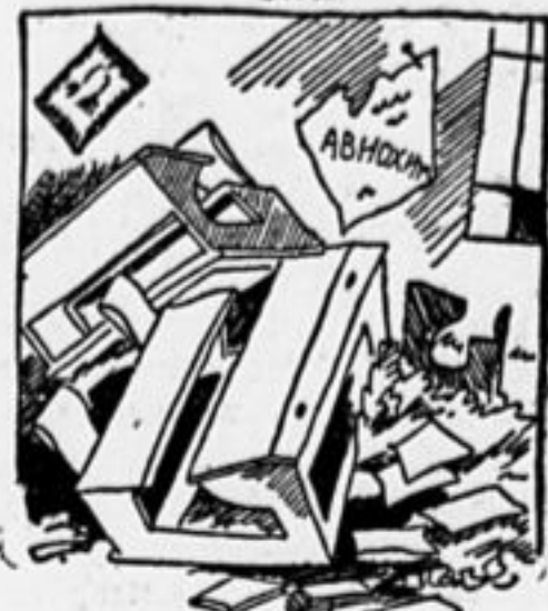
Это школа — не смущайтесь Если хаос видите, Не кричите, не ругайтесь: Школьников обидите.