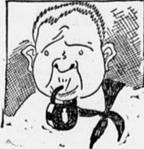
Он ругаться привыкает, Не устал его роток, А нельзя-ли (как бывает) Наложить ему замок.