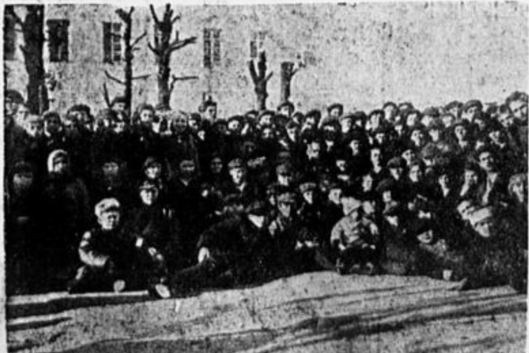
1-е губернское совещание детских корреспондентов Московской губернии при «Пионерской Правде».

Пионеры, помните! Здоровая смена, залог победы рабочего дела. РЕВЕРУТ.