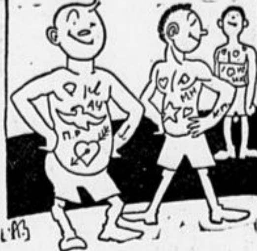
Посмотри — татуировка Замечательно сидит У ребят уж есть споровка, Жаль вожатый не глядит.