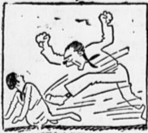
Есть у нас ура-ребята Не удар—картина, Ноги крепки, длинноваты, Знать растёт детина.