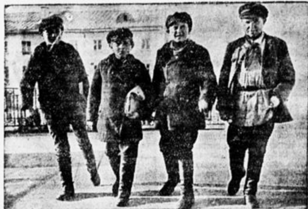
Делегаты совещания детских корреспондентов спешат на заседание

В нем мы храним экспонаты с обследуемых заводов и записываем наблюдения над жизнью и бытом рабочих.