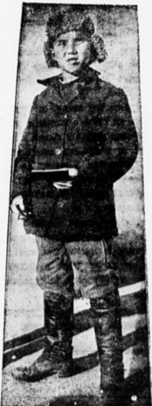
Делегат совещания детских корреспондентов.