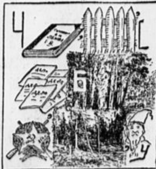
Логогриф. (С. Герасимова). С «С» — я поту означию,

С «Р» — артисты учат нас, С «Н» — я цифро бываю, С «М» — летаю среди вас.