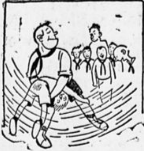
Шла борьба, рычал вожатый, Вокруг весёлый гул стоял... Вожатый — парень тароватый, Троих уж на лопатки клал.