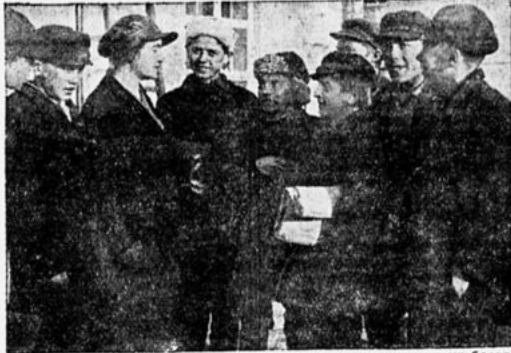
Во время обеденного перерыва делегаты из деревень ведут беседу.

От МК РЛКСМ—т. Матвеев—под крики «ура» — напоминает ребятам, что они должны выработать из себя здоровую, сильную смелую, что они должны стать достойными комсомольцами.